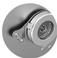
Crypton sans reconstitueur Zircon without portioner