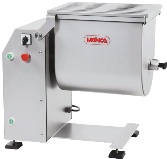
RM-20 / RC-40