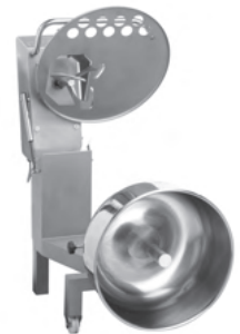
Position nettoyage Cleaning position