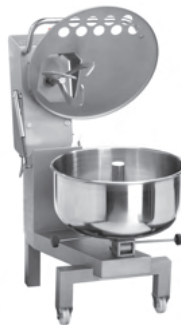
Position chargement Loading position