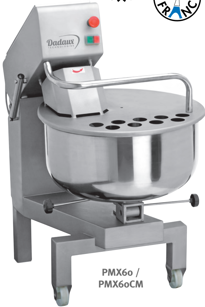
PMX60 / PMX60CM